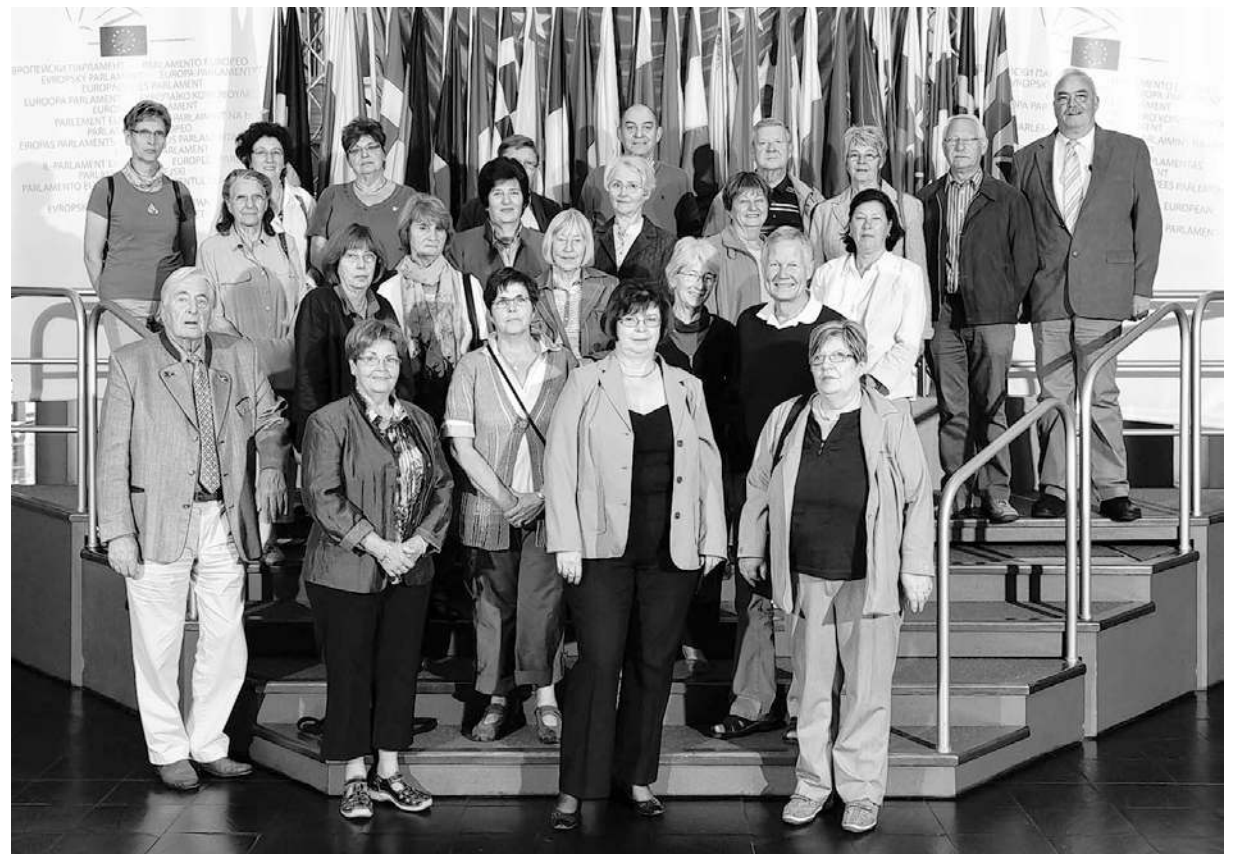
Unser Bild zeigt die Reisegruppe der Europa-Union Geilenkirchen im Gebäude des Europäischen Parlamentes in Straßburg.

Breisgau mit dem Besuch des Münsters, die Besichtigung des Straßburger Münsters sowie eine Stadtführung und eine Bootsfahrt auf der Ill. Die Elsassische Weinstraße mit der obligatorischen Weinprobe durfte ebenso wenig fehlen wie der Besuch der Stadt Colmar, bekannt wegen ihrer Fachwerkhäuser und des Colmarer Altars. Hochzufrieden kehrten die Geilenkirchener zurück in der Gewissheit, mit neuen Informationen und schönen Erlebnissen in den Herbst gestartet zu sein.